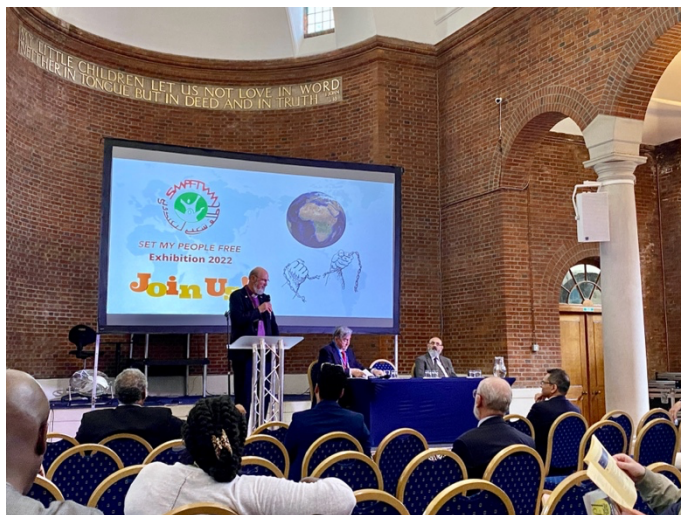
Bischof Thomas Schirmmacher während seiner Rede

(Bonn, 20.09.2023) Bei einer Nebenveranstaltung im Rahmen des Internationalen Ministertreffens zur Religions- und Glaubensfreiheit in London im Juli 2022 sprachen christliche Konvertiten aus dem Islam über die realen Folgen von Apostasie- und Blasphemiegesetzen, die in vielen Ländern in Kraft sind. An der Veranstaltung und der dazugehörigen Ausstellung mit dem Titel „Keine Strafe für Apostasie“, die von der Organisation Set My People Free organisiert wurde, nahmen hochkarätige Redner teil, darunter Ahmed Shaheed, UN-Sonderberichterstatter für Religions- und Glaubensfreiheit, und der Generalsekretär der Weltweiten Evangelischen Allianz (WEA), Bischof Dr. Thomas Schirmmacher. Sie und andere schilderten, wie Apostasie- und Blasphemiegesetze die individuellen Freiheiten verletzen und vor allem gegen ehemalige Muslime eingesetzt werden.