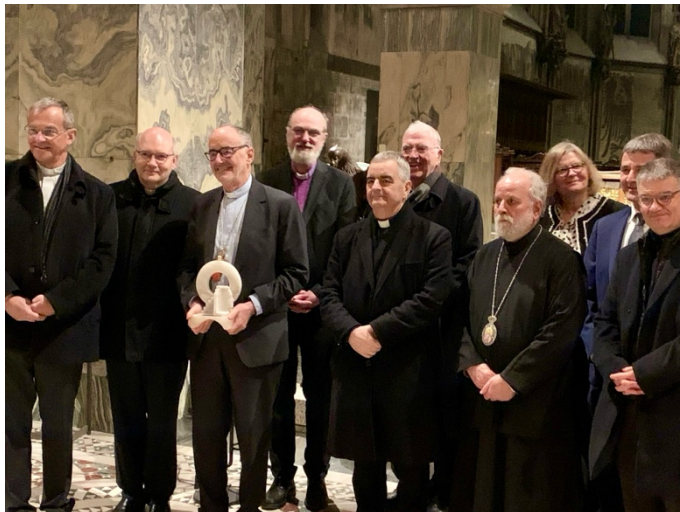
Während der Preisverleihung

Der 1946 in der damaligen Tschechoslowakei geborenen Michael Czerny wuchs in Kanada auf und trat mit 18 Jahren den Jesuitenorden ein. Nach seiner Priesterweihe 1973 war Direktor des Instituts für Menschenrechte in San Salvador und gründete das jesuitische Afrikanische Aids-Netzwerk. Papst Franziskus weihte ihn 2019 zum Bischof und berief ihn ins Kardinalskollegium. Seit 2022 leitet Czerny die vatikanische Entwicklungsbehörde. Bekannt wurde er als vatikanischer Migrationsexperte, der beständig eine offenere Migrationspolitik der EU und mehr Engagement gegen Menschenhandel und Ausbeutung forderte.